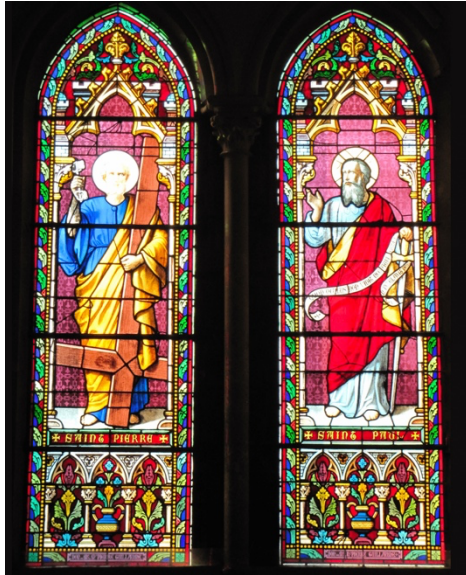
Vidriera de colores, Sts. Pedro y Pablo y los instrumentos de sus martirios. Iglesia de Santo Tomás, Jersey

La relación entre los dos puede ser instructiva para nosotros como cristianos modernos. Del libro Santas, Santos , “Pablo, el judío bien educado y cosmopolita de la Dispersión, y Pedro, el pescador sin educación de Galilea, tuvieron diferencias de opinión en los primeros años de la Iglesia con respecto a la misión a los gentiles. Más de una vez, Pablo habla de reprender a Pedro por su continua insistencia en la exclusividad judía; sin embargo, su compromiso común con Cristo y la proclamación del Evangelio resultaron más fuertes que sus diferencias; y ambos llevaron finalmente esa misión a Roma” (HWHM, 446). ¿Dónde podríamos dentro de la Iglesia aprender a apreciar los diferentes puntos de vista de cada uno? ¿Cómo puede nuestro compromiso común con Jesucristo y el Evangelio llevarnos a la prueba y más allá?