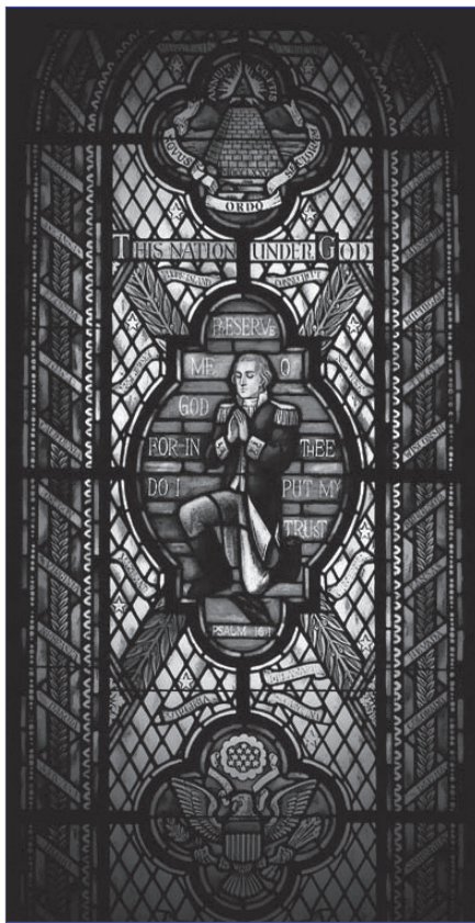
Ventana en la Sala de Oración del Congreso representa a George Washington en oración, rodeado de los nombres de los 50 estados y del sello de Estados Unidos de América.