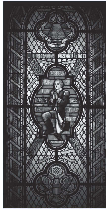
Ventana en la Sala de Oración del Congreso representa a George Washington en oración, rodeado de los nombres de los 50 estados y del sello de Estados Unidos de América.

Sólo cuatro episcopales han sido capellanes de la Cámara, siendo el más reciente el reverendo John Lindsay Summerfield, que concluyó su mandato de dos años en 1885. Hasta el siglo XX, la mayoría de los capellanes de la Cámara servían por un período de dos años, pero en los últimos años, la norma ha sido una tenencia mucho más larga. La más larga hasta la fecha ha sido la de James Shera Montgomery, un ministro metodista que asumió el cargo en 1921 y sirvió durante 28 años. Metodistas y presbiterianos han dominado la capellanía de la Cámara; otros han sido bautistas, congregacionalistas, Discípulos de Cristo, luteranos, unitarios y universalistas.