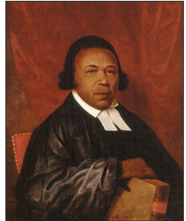
Retrato de Absalom Jones por Raphaëlle Peale, en 1810

Jones se convirtió en un miembro activo de la Iglesia Metodista Episcopal de San Jorge en Filadelfia, sirviendo como predicador laico de los miembros negros de la congregación. Fue un orador dotado, y Jones incrementó la membresía de los negros en la Iglesia a un ritmo tan rápido que los feligreses blancos comenzaron a tratar de separar la congregación; los funcionarios de la iglesia les dijeron a los feligreses negros que iban a tener que sentarse en el balcón. Después de un servicio de domingo en noviembre de 1786, cuando los escoltas trataban de obligar a todos