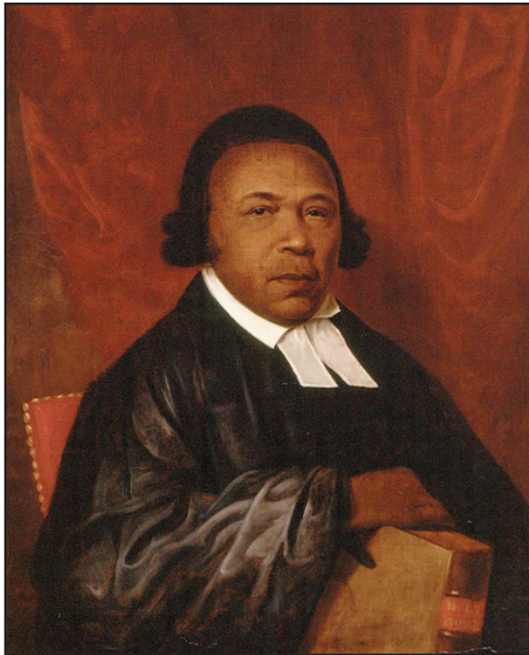
Retrato de Absalom Jones por Raphaëlle Peale, en 1810

Jones se convirtió en un miembro activo de la Iglesia Metodista Episcopal de San Jorge en Filadelfia, sirviendo como predicador laico de los miembros negros de la congregación. Fue un orador dotado, y Jones incrementó la membresía de los negros en la Iglesia a un ritmo tan rápido que los feligreses blancos comenzaron a tratar de separar la congregación; los funcionarios de la iglesia les dijeron a los feligreses negros que iban a tener que sentarse en el balcón. Después de un servicio de domingo en noviembre de 1786, cuando los escoltas trataban de obligar a todos